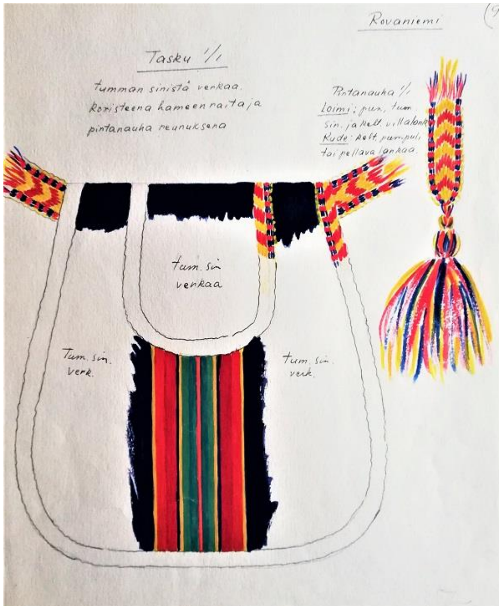
Rovaniemen kansallispuvun tasku.

mallin mukaisessa taskussa on käytetty sekä hamekangasta että liivin verkkaa, joita reunustavan pirttanauhan malli on rovaniemeläisistä kengänpauloista.