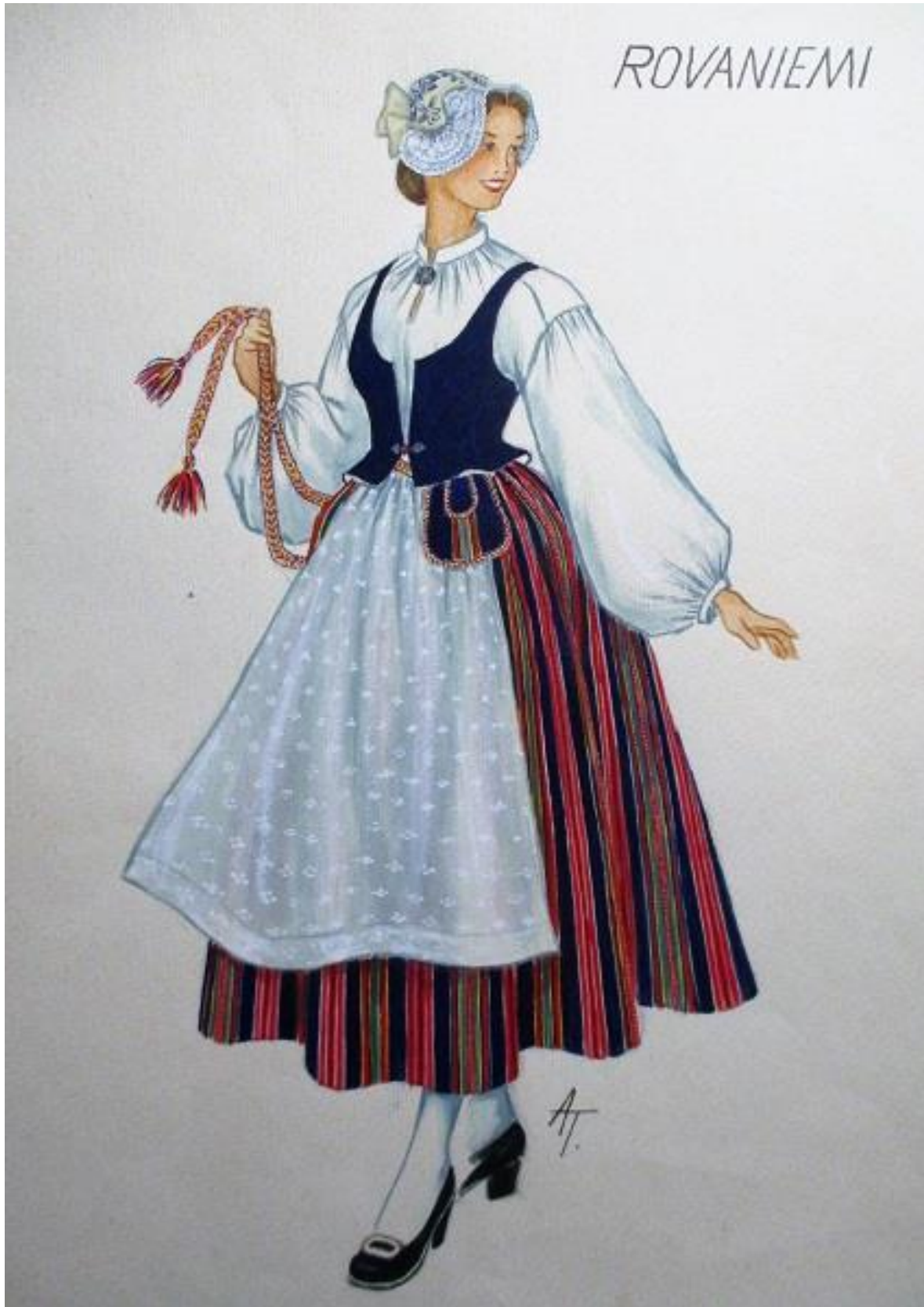
Alli Tourin vesiväripiirros Rovaniemen kansallispuvosta.